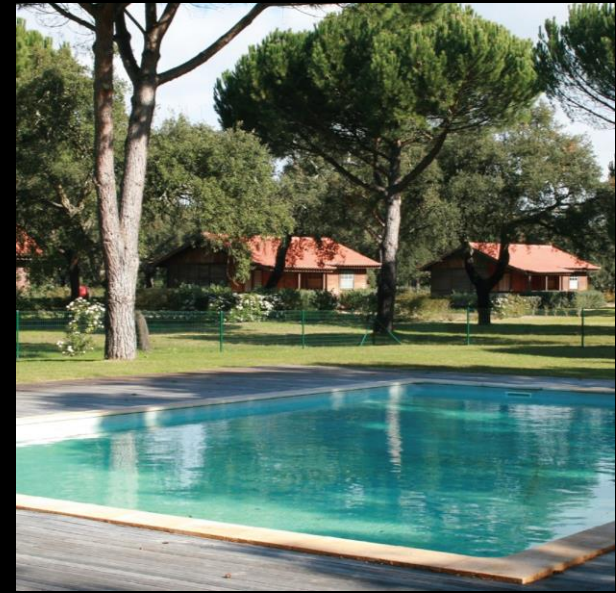
COMPANHIA DAS LEZIRIAS