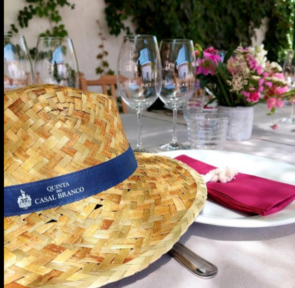
QUINTA DO CASAL BRANCO