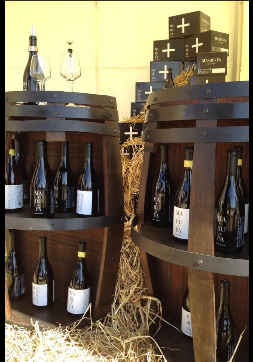
ALEGRE SOCIEDADE AGRÍCOLA